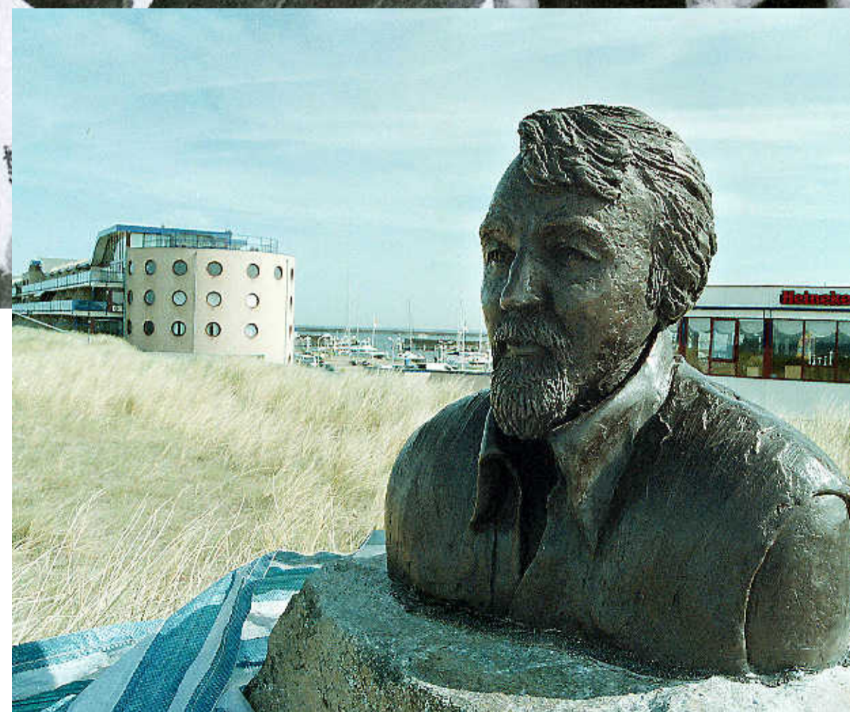
Het borstbeeld van Cornelis Vrolijk op de top van de duinen bij de zee.